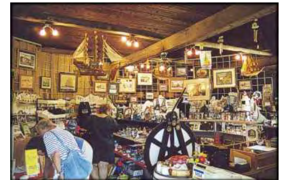
À l'intérieur de la boutique « Depot »