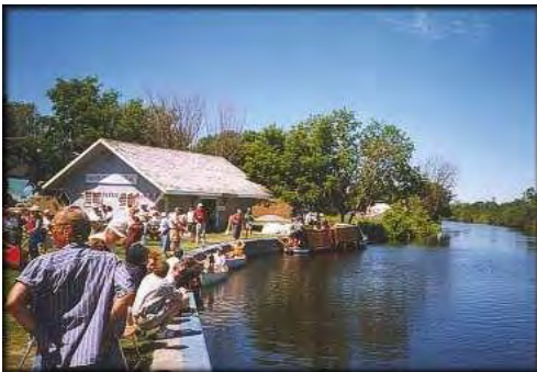
La boutique « Depot »

Notre boutique, ouverte durant la saison de navigation, est située dans le parc du blockhaus près de l'écluse d'amont de Merrickville. On y trouve un terrain de stationnement et de grands espaces où pique-niquer ou regarder passer les bateaux sur le canal.